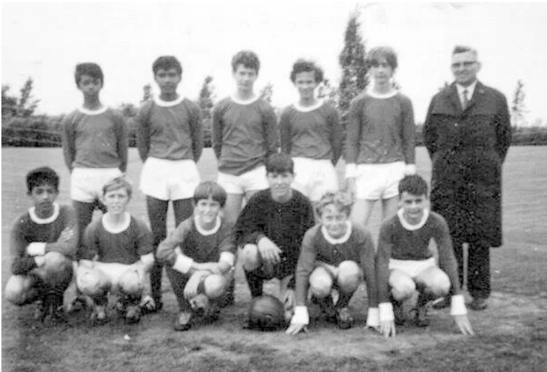
Een JVC-jeugdteam uit 1969, met drie Molukse spelers

Vanaf dat moment moesten zij een weg vinden in de Nederlandse samenleving en hield de zorg van de Nederlandse overheid op.